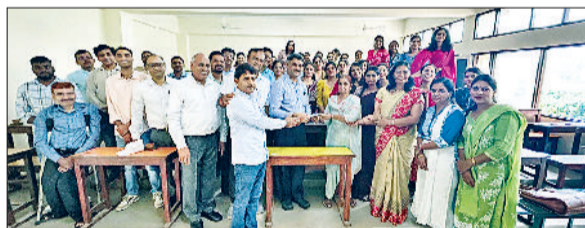
रेवाड़ी। कार्यक्रम में उपस्थित शिक्षक व कॉलेज स्टाफ।