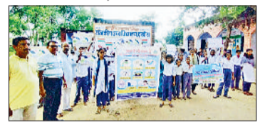
रेवाड़ी। कार्यक्रम में जल संरक्षण की शपथ लेते विद्यार्थी।