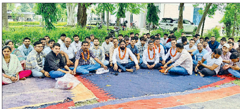
आह्वान पर अपने-अपने कार्यालय व विद्यालय में एनपीएस व यूपीएस के विरोध में एक दिवसीय उपवास रखा। हरियाणा के जिला रेवाड़ी व