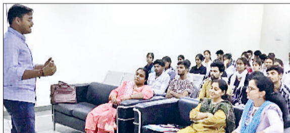
रेवाड़ी। विद्यार्थियों को जानकारी देते हुए वक्ता।